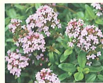
タイム (第3話タイトル) 花言葉 待機する悪女予備軍