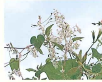
ナツユキカズラ (第11話タイトル) 花言葉 今年の冬に降る雪