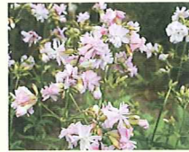
サボナリア (第7話タイトル) 花言葉 風呂上りの若妻