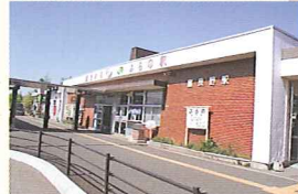
貞美が降り立った富良野駅