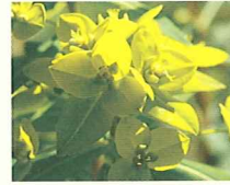
ユーフォルビア (第10話タイトル) 花言葉 乙女の祈り