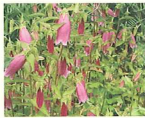
カンパニュラ (第5話タイトル) 花言葉 花園の小人の禿かくしの帽子