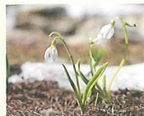
スノードロップ (第1話タイトル) 花言葉 去年の恋の名残りの涙

「北の国から」で知られる脚本家・倉本聰がフジテレビ開局50周年記念として富良野を舞台に書き下ろしたドラマ「風のガーデン」。死を目前にした主人公が絶縁していた家族のもとへ戻ってゆく物語を通し、「生きること・死ぬこと」が描かれた作品。(2008年10月～12月、11話放送)