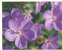
ゲラニウム (第4話タイトル) 花言葉 大天使ガブリエルの哀しいあやまち