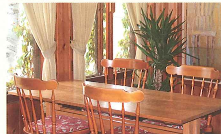
最終回で貞三と妙子が貞美の介護について話しあう喫茶店 10:00~16:00 不定休(季節により変動あり)