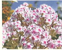
フロックス (第8話タイトル) 花言葉 妖精たちの新盆の迎え火