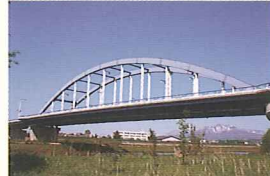
白鳥医院からルイや岳がガーデンに向かう時に渡る橋。橋の下には空知川が流れる