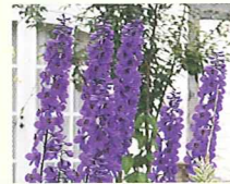
デルフィニウム (第6話タイトル) 花言葉 天使ガブリエルの蒼いマント