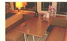
上原さゆりがルイに貞美と会って話を持ちかけたレストラン 11:00~20:00 無休