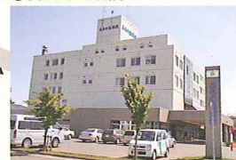
貞美が麻酔を手伝った病院