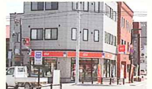
貞美が携帯電話を借りたお店