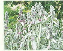
ラムズイヤー (第9話タイトル) 花言葉 生まれたばかりの孫の耳たぶ