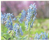
エゾエンゴサク (第2話タイトル) 花言葉 妖精たちの秘密の舞踏会